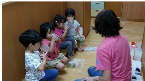
食事前も水分補給の時も、上手にコップを持つことが出来ています。