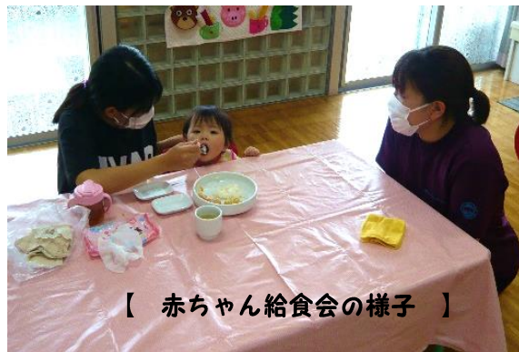
【 赤ちゃん給食会の様子 】