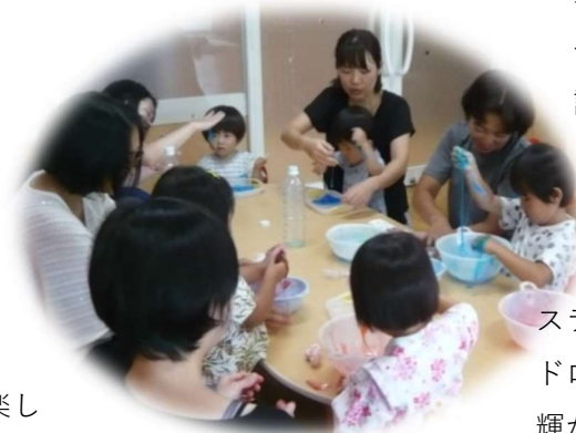
スライム遊びをしました。ドロドロのスライム作りに目を輝かせあそびました。