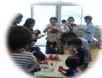
パパサロンでスイカ割りごっこ。一玉の大きなスイカをみんなで試食しました。

10月のチャイルドケアでは、LAVA インターナショナルと共催で、ハピママヨガを行います。ハピママヨガとは、みんなで歌いながら子どもをマッサージしたり、子どもに触れながらポーズをとる、初心者でも簡単にできるヨガだそうです。ヨガを通し、ママと赤ちゃんやママ