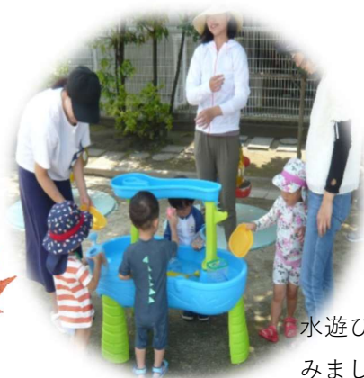
水遊びを楽しみました。

暑かった夏は、あっという間に終わってしまいましたね。夏休みの時期ですがたくさんの方の来所があり、たくさん遊びを皆さんと楽し